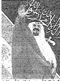
زيارة الأمير سلطان لآسيان

بسمو ولي العهد، وصل إلى مدريد في مستهل زيارة رسمية لإسبانيا