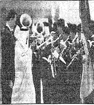
الأمير سلطان مع حرس الشرف