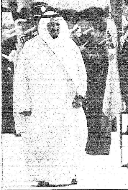
الأمير سلطان يستعرض حرس الشرف