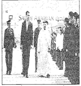
الأمير سلطان مع حرس الشرف وولي عهده ولي العهد آل سعود

نتطلع إلى استمرار الدور الإسباني البناء لدعم جهود السلام في المنطقة