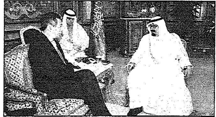
خادم الحرمين مستقبلاً رئيس وزراء سنغافورة

الوزير المرافق ومعالي مستشار خادم الحرمين الشريفين الأستاذ عبدالمحسن بن عبدالعزيز التويجري ومعالي محافظ مؤسسة النقد العربي السعودي الأستاذ حمد السباري ومعالي أمين عام مجلس الوزراء الأستاذ عبد الرحمن السدحان ومعالي المستشار في الديوان الملكي الأستاذ عادل بن أحمد الجبير وسفير خادم الحرمين الشريفين لدى جمهورية سنغافورة محمد كردي.