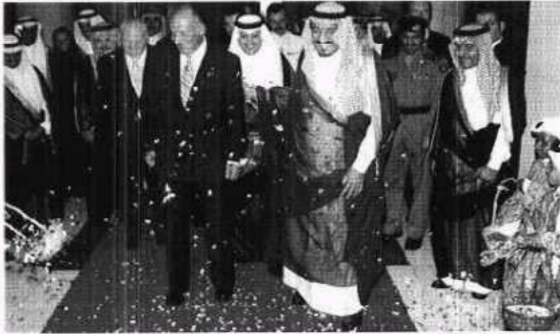
بالزهور استقبل العاهل الإسباني في الحفل الذي أقامه سمو أمير منطقة الرياض في قصر الحكم

العاهل الإسباني الذي رافقته حرمه الملكة صوفيا ووفد رسمي رفيع ضم وزير الخارجية ووزير الصناعة بالإضافة إلى ٢٠ مسؤولاً من كبريات الشركات الإسبانية، واستهل العاهل الإسباني زيارته بقاء خادم