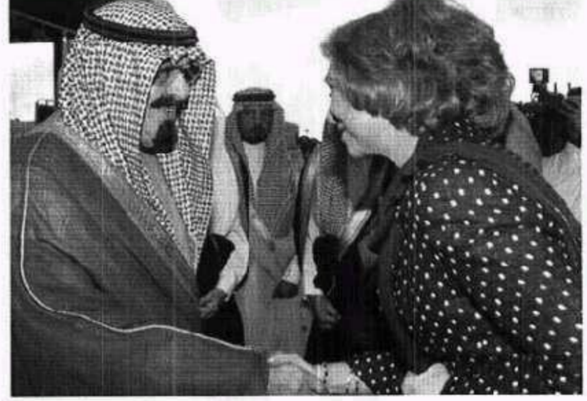
الملك عبدالله يستقبل الملكة سونيا