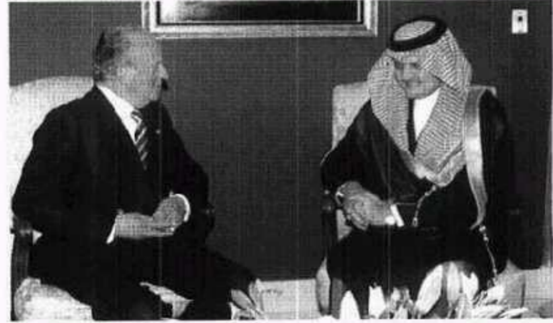
حديث بين الملك خوان كارلوس والأمير سعود الفيصل