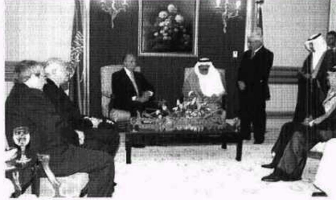
العاهل الإسباني و الأمير نايف بن عبدالعزيز