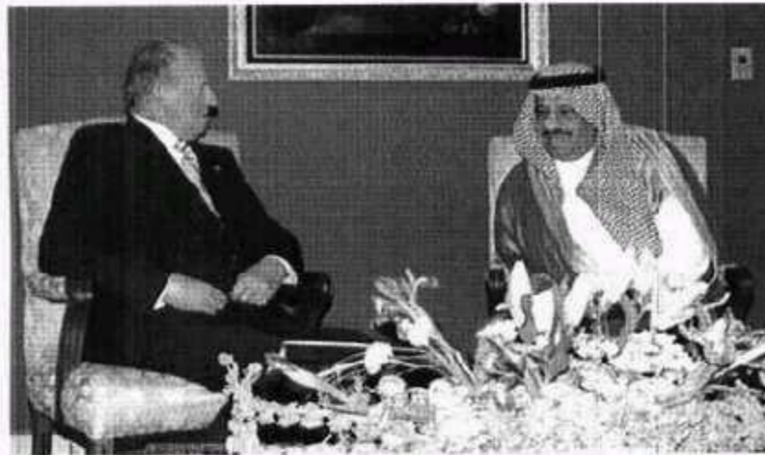
الملك خوان كارلوس والأمير خالد بن سلطان

وحضت زيارة العاهل الإسباني باللقاءات مع الوزراء وكبار المسؤولين في القطاعات الاقتصادية المختلفة، فقد استقبل في مقر إقامته صاحب السمو الملكي الأمير خالد بن سلطان بن عبدالعزيز مساعد وزير الدفاع والطيران للشؤون العسكرية ومعالي وزير البترول والثروة المعدنية ومعالي وزير الكهرباء ومعالي وزير النقل ورئيس شركة أرامكو، وفي كل هذه اللقاءات جرى بحث مجالات التعاون مع الشركات الإسبانية في مشروعات التنمية السعودية في مختلف القطاعات، والفرص المتاحة للاستثمار في المملكة. كما استقبل الملك خوان كارلوس وفداً من رجال الأعمال. وفي مؤتمر صحفي مشترك عقده صاحب السمو الملكي الأمير سعود الفيصل وزير الخارجية ونظيره