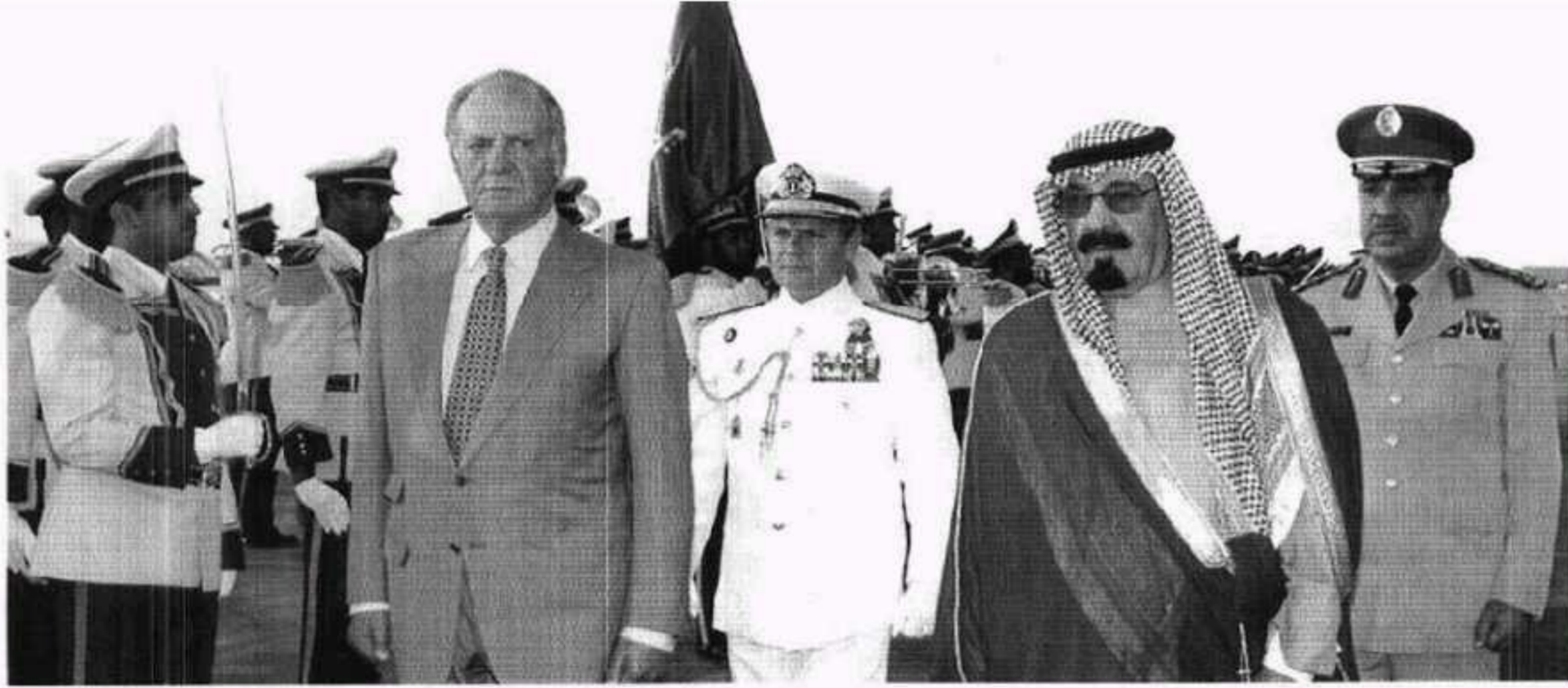
خادم الحرمين الشريفين كان على رأس مستقبلي العاهل الإسباني الملك خوان كارلوس