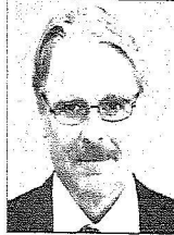
سفير النرويج لدى المملكة