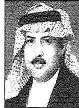
سفير المملكة لدى النرويج

إلى ذلك غادر صاحب السمو الملكي الأمير سلمان بن عبدالعزيز أمير منطقة الرياض أمس إلى مملكة النرويج في زيارة رسمية، وكان في وداع سموه في مطار قاعدة الجوية صاحب السمو الملكي الأمير سطام بن