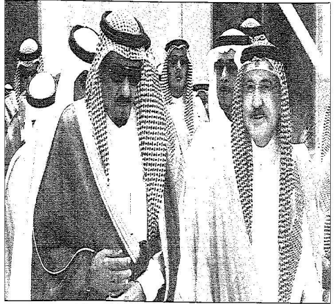
الأمير سلمان بن عبدالعزيز وفي مقدمة سموه الأمير سلطان بن عبدالعزيز

السفير فيبي: الزيارة دفعة قوية لتنمية العلاقات وفرصة لبحث التطورات العالمية الجديعة: الجولة في سياق جهود سموه المتواصلة لتنمية وتطوير العلاقات الخارجية