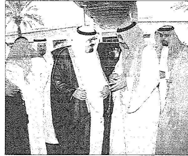
الملك المفدى يتحدث للأمير مشعل بعيد وصوله نجران

وقد وصل يحفظ الله ورعايته خادم الحرمين الشريفين إلى نجران عصر أمس قادماً من جدة في مستهل جولة تفقدية لمنطقة نجران ومنطقة عسير ومنطقة جازان مطلع خلالها حفظه الله على