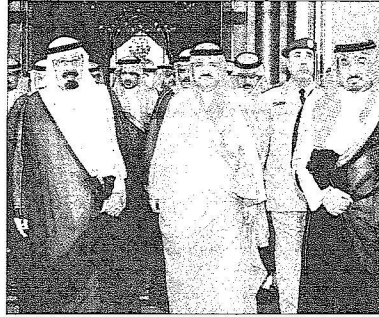
الملك لدى مفادته جدة

أحوال المواطنين ويلتقي بهم ويستمع منهم ويضع حجر الأساس ويبدشن عدداً من المشروعات التنموية المهمة وذلك ضمن زيارته أيده الله التفقدية لجميع مناطق المملكة. وكان في استقبال الملك المفدى لدى وصوله مطار نجران سمو ولي العهد وسمو أمير منطقة نجران وعدد من أصحاب السمو الملكي والسمو الأمراء وكبار المسؤولين من مدينتين وعسكريين وجمع