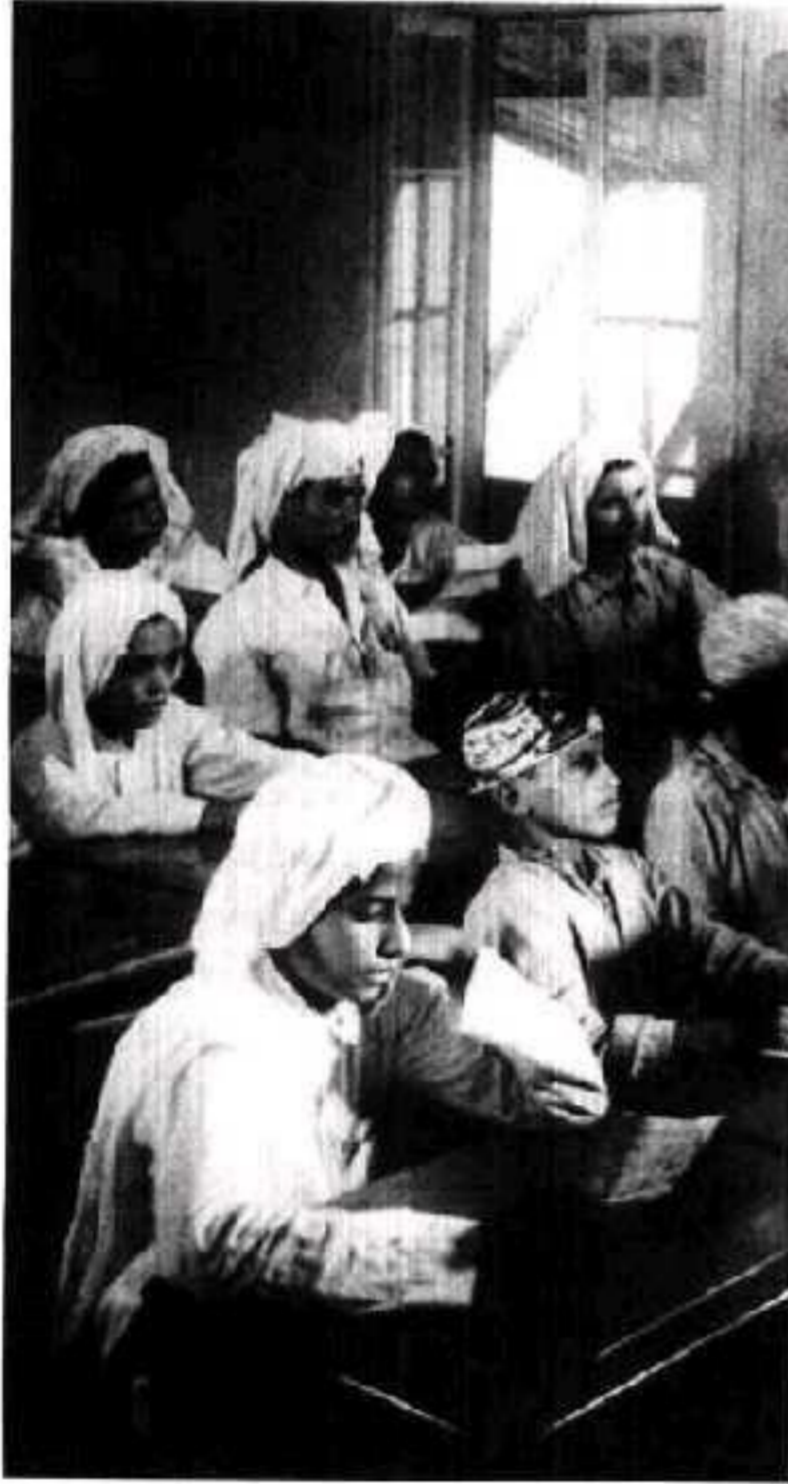
فيما بعد) واختار لإدارتها أحد أبناء البلاد هو السيد صالح شطنا.