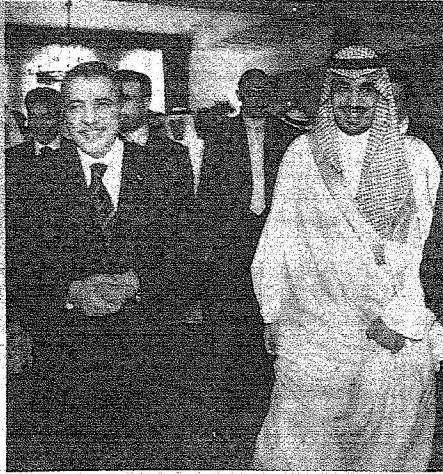
مع وزراء الشباب العرب في اجتماع الجامعة العربية