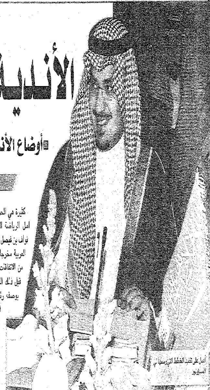
أمير على شرف الخطبة الرئيسة في الرياض

كثيرة هي الحوارات الصحفية التي أجريت مع الأمير الشاب واحد.. وفيه تحدث نواف المران: المسئول الرياضي عن الأمور بكل أمل الرياضة السعودية العربية في السلعة الدولية الأمير صراحةً وشفافية.. عن الانتقادات وتشكيلات الاتحادات الرياضية.. عن نواف بن فيصل بن نهرجل القانون الذي وجد لدرجات الألعاب الدور السعودي بوليا وأسبانيا.. عن القرائل التي جنتها الفرق السعودية العربية متخرجاً في الاعتراف الدولي بيا والذي هتس بعد من دوري أبطال العرب... عن الحوار الدائر عن الاعتراف وإلوانه.. من الاتقادات الرياضية مع الدول الشقيقة والصديقة وهو المشاركة الأولمبية في ألعاب بكين.. والإسباب التي جعلت اختيار أعضاء قبل ذلك الرجل الذي يصل مثل كرة القدم السعودية اتحادي القدم والفروسية من اختصاصات الرئيس العام وثاني يومه، رئيساً لجنة المنتخبات الوطنية ويغير ذلك من العوام التي شغته عن نفسه وجهاته الشخصية عن لخطات ششطن أن سرفها من وقت العطل طم نجد فأعطانا هذا أكثر من عفرسنوا، نيقور أخيراً الكمال الوقت من ساعات راحة القلبه جادوبينما نحن تجري الحوار وكانت نصف دية والتشج الحياة كالة. الأسئلة غداً تبال بالعرف (إبدالله كم بقي ليك من الأسته لدي أجراء سمعه عدداً من المحورات في اعمال أخرى | قلت ثلاثة وربما أربعة لأنها فرصة لاتوضع مستكون مطوعات محبة وعربية وحتى فخرية نية.. الأ في المستقبل لكر اشغلائهم تواصل الحوار الذي كات هذه محصلة إن حوارنا هذا جمع كل الأحداث في سلة النهائية.