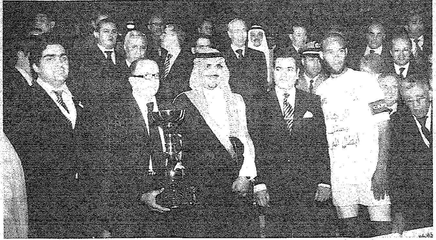
تأسس يقود الرجاء المغربي بكأس دوري أبطال العرب