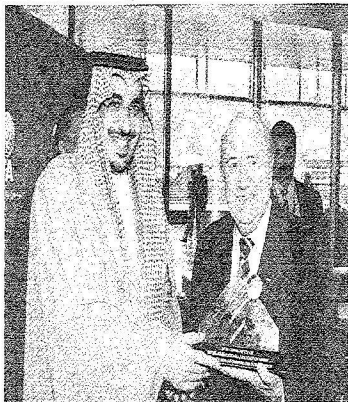
معه يقدم عميداً خاصة الرئيس الاتحاد الدولي

مملكة الإنسانية أجمل صفة تمصادقنا الدولية بلا تروغ يعلمان من هي السعودية وما هو دورها الدولي