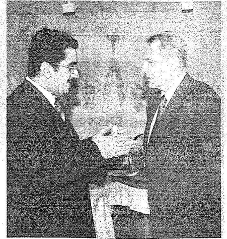
حديث جانبي بين سموه ورئيس اللجنة الأولمبية