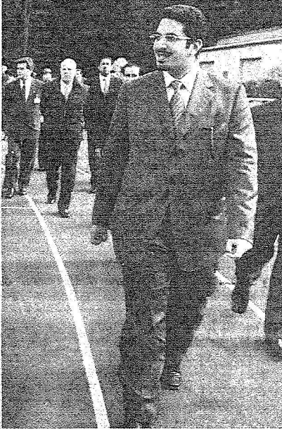
متوجه إلى تدريب المنتخب في ألمانيا

■ السعودية تصنع الأحداث الكروية في آسيا ولا تسير في ركب أحد