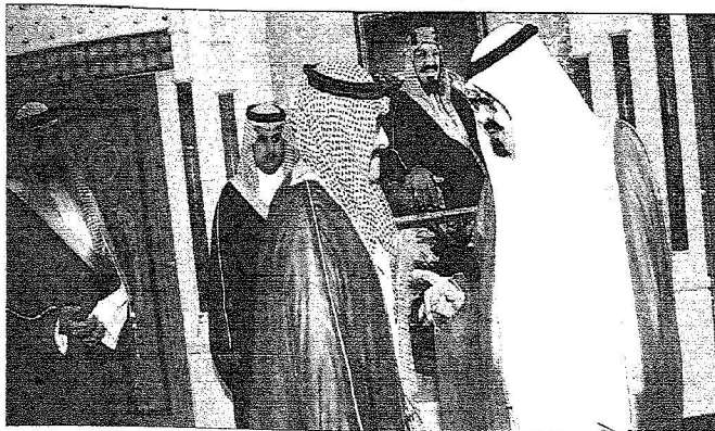
خدام الحرمين الشريفين يعزى الأمير محمد بن نواف في زيارة لخطه "أولس"