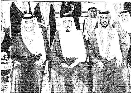
الامراء (من اليمين) عبد العزيز بن عبد الله منصور بن ناصر، وبندر بن سلمان بن محمد

الإله بن عبد العزيز مستشار خادم الحرمين الشريفين، وصاحب السمو الملكي الأمير مقرن بن عبد العزيز رئيس الاستخبارات العامة. كما حضر اللقاء، صاحب السمو الملكي الأمير نايف بن سعود بن عبد العزيز، صاحب السمو الأمير بندر بن سعود بن محمد بن سعود آل سعود مستشار خادم الحرمين الشريفين، صاحب السمو الأمير خالد بن عبد العزيز بن عيافة وكيل الحرس الوطني لشؤون الأفواج، صاحب السمو الملكي الأمير نواف بن مساعد بن عبد العزيز، وعدد من الوزراء وكبار المسؤولين. وفي شأن آخر، بحثاً خادم