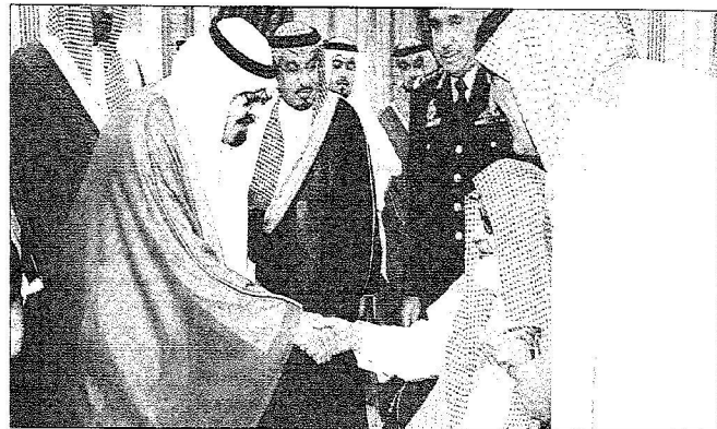
خدام الحرمين الشريفين مصافحاً مواطناً منسأ لدى استقباله في الرياض أمس (أولس)