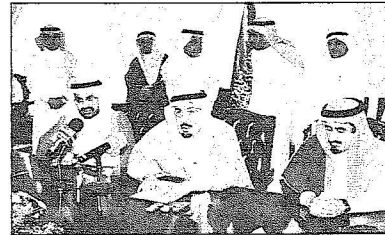
لتقنان من التوقيع

د. العطية: كانت ميزانية التعليم العالي قبل أربع سنوات 325 مليوناً والآن تفوق 12 مليار ريال