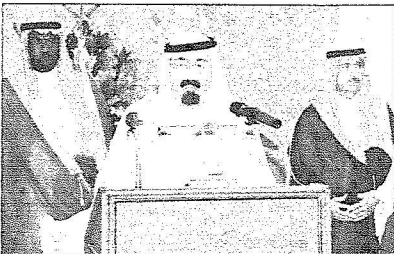
خادم الحرمين الشريفين يلقى كلمته

وأفاد أن تنفيذ هذه الخطط جاء بمتابعة دقيقة من صاحب السمو الملكي الأمير خالد الفيصل