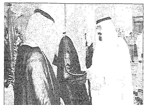
خادم الحرمين الشريفين يصفاح سماحة المفتي العام

الفريق القحطاني : الخطط الأمنية نفذت بدقة كونها جاءت وليدة الدراسات العميقة والتنسيق المباشر