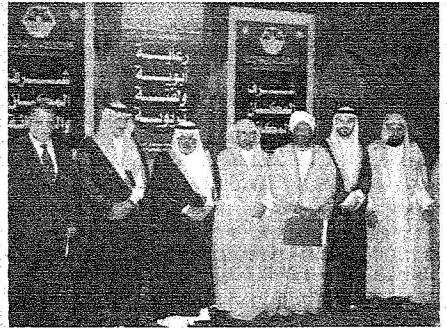
عدد من أعضاء هيئة الجائزة