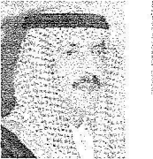
الامير محمد بن نايف