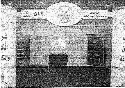
احدى ضمانيات الجائزة