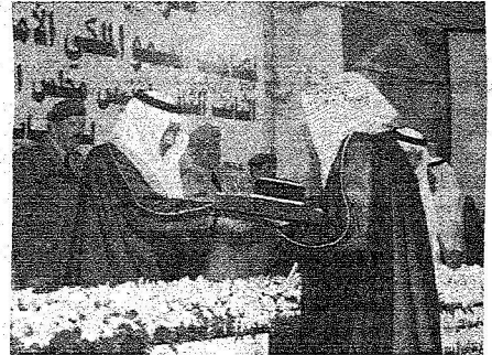
سموه وتوزيع جوائز العام الماضي