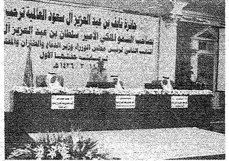
جانب من مسابقة العام الماضي