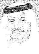
الامير سعود بن نايف