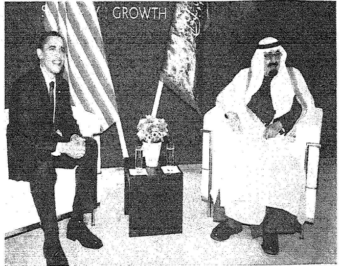
خادم الحرمين يستقبل باراك أوباما في لندن حيث شارك الزعيمان في قمة مجموعة العشرين.