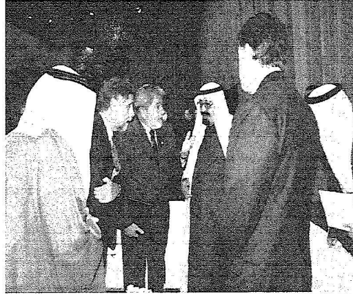
حديث بين الملك والرئيس البرازيلي

ديسلفا رئيس البرازيل وذلك على هامش القمة الاقتصادية لمجموعة العشرين في لندن.