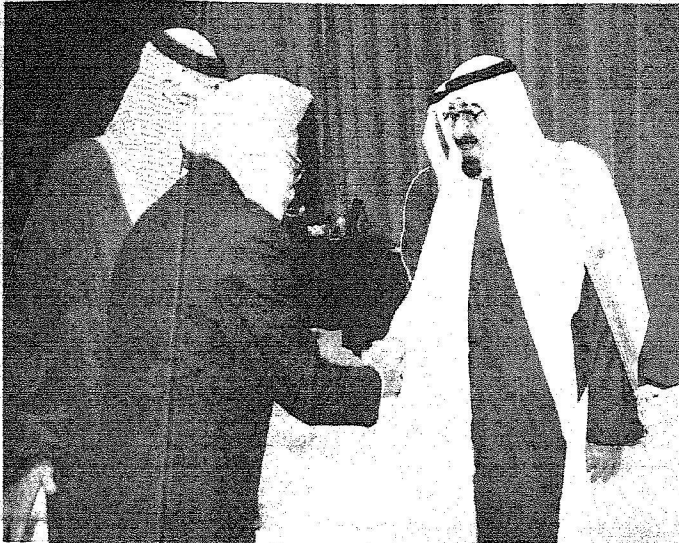
.. وهنا يلتقي رئيس وزراء الهند..