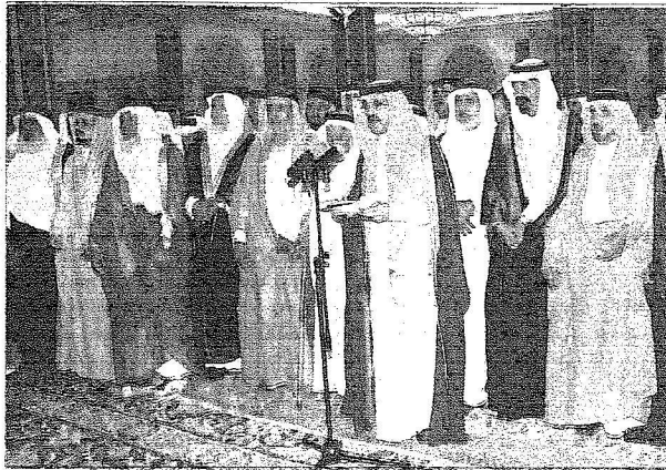
وفد من أهالي نجران يهتفون الملك بالإنجازات الأمنية التي أحيحت مساعي الفئدة الضالعة

عالي ورئيس البنك الإسلامي لشركم على ما عبرتم عنه من مشاعر طيبة، تجاه ما يلقاه البنك من دعم ورعاية من