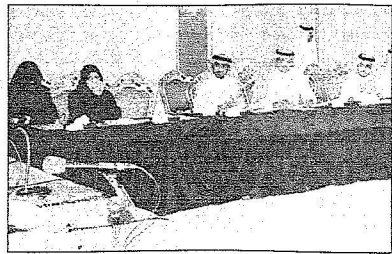
جانب من المؤتمر