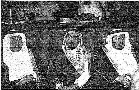
جانب من حضور افتتاح الفعاليات الثقافية