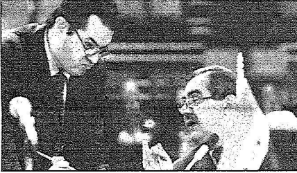
وزير الخارجية العراقي فوئاد مزيار يخلل الاجتماع

وحول المسألة النووية فإن القمة ستكون مدعوة للتأكيد على ضرورة الوصول الى حل سياسي لللف النووي الإيراني مع الأخذ بالاعتبار هدف إخلاء منطقة الشرق الأوسط من الأسلحة النووية على نحو لا يقبل الاستثناءات والحفاظ على حقوق كافة الدول الموقعة على معاهدة منع الانتشار النووي في الاستفادة من الطاقة النووية للأغراض السلمية وبموجب الاشتراطات الدولية المعروفة . واني أعتقد جازماً أن من أهم ما ستخذه القمة هو مسألة النهوض بمفهوم الأمن العربي المشترك على النحو الذي يجعل هذا المفهوم أكثر شمولية واتساعاً بحيث يستوعب ليس فقط البعد العسكري وإنما جملة التحديات الأمنية والاقتصادية والثقافية والحضارية التي تواجه أمتنا العربية وتستدعي منا استعداداً وتأهيلاً خاصاً . وبالنظر للعلاقة الخاصة بين ثقافة الشعوب وشخصيتها وهويتها وما يشهدها الوضع الثقافي العربي من تحديات واختراقات يمكن أن تمال جواهر هويتنا فقد أصبح لزاماً علينا أن نلتفت إلى البعد الثقافي وما يستتبعه من وقفة تأمل ومراجعة شاملة بما يكفل التصدي لمشاكل التعليم والثقافة في عالمنا العربي ويوضح معالم الطريق المؤدي لتخصيصها ومعالجتها . حاولت فيما مضى أن أضغكم في أجواء هذه الاهتمامات والمشاغل التي تستعين على أعمال مجلسنا الوزاري والقمة العربية القائمة على سبيل المثال وليس الحصر وعلى قاعدة الأهم قبل المهم ولا يستعني في ختام هذه الكلمة إلا أن أعبر لكم عن خالص تمنياتي .