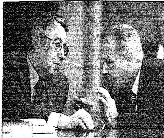
حديث بن وزير الخارجية المصري والنقيب قبل بدء الاجتماعات

الأمير سعود الفيصل: الممثلة حريصة على فروم القمة بصوت عربي واحد إزاء القضايا المصرية وزير الخارجية السوداني: لابد أن يتعامل المجتمع الدولي بإيجابية مع حكومة الوحدة الفلسطينية موسى: الأمن والطرم الجماعي لحل النزاع الأهم والقضايا الاقتصادية ميزت الاجتماعات التحضيرية