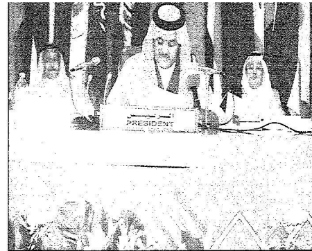
الأمير سعود الفيصل يلقى كلمته خلال الاجتماع