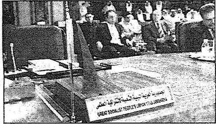
المعهد الليبي فارغاً خلال الاجتماعات

عقب ذلك بدأت أعمال الجلسة المغلقة الأولى للاجتماع لاعتماد مشروع جدول الأعمال ومناقشة مشاريع القرارات المرفوعة من اجتمعاء المنوبين الدائمين بالجامعة العربية وكبار المسؤولين.