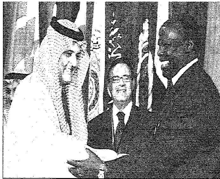
الأمير سعود الفيصل وثلاثة رؤساء الدورة العادية للمجلس الوزاري من الدول