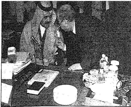
سمو وزير الخارجية خلال الاجتماع التحضيري