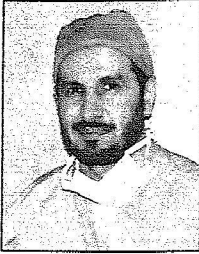
د. عبد الله الربيعه