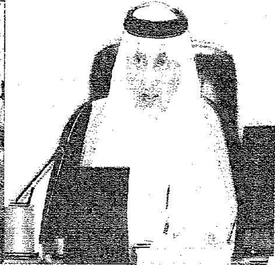
الأمير خالد الفيصل