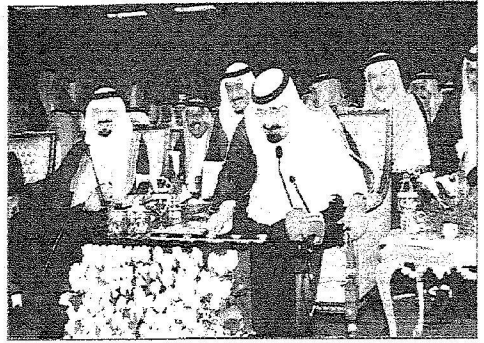
خادم الحرمين الشريفين يصفق على الفوز منشأ مشروعات الرياض الحديثة