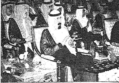
ويصق مبدئاً أعجاب بهما يشاهده من عروض الأناجارت القتموية