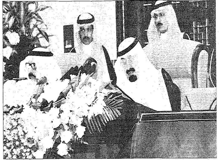
خادم الحرمين الشريفين يلقي كلمته أمام « الشورى »