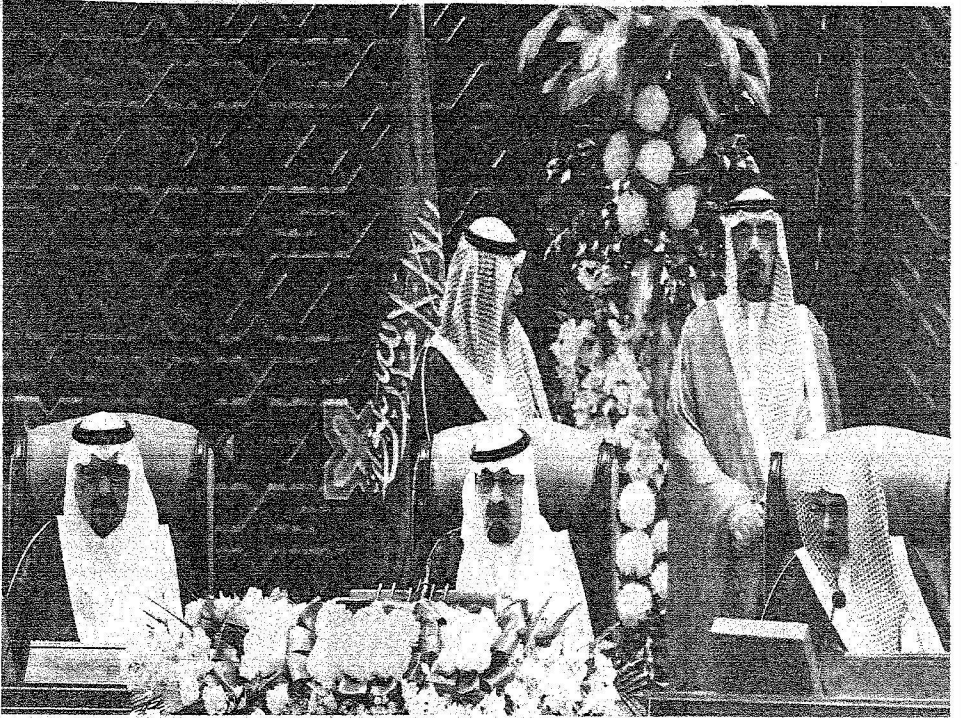
خادم الحرمين أداء النفاذ كلمة سابقة في مجلس الشورى