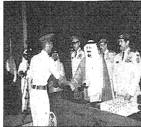
الأمير سلطان يسلم الشهادات للخريجين

الأمير سلطان: قائدنا الأعلى أوصل الأمن إلى الجميع