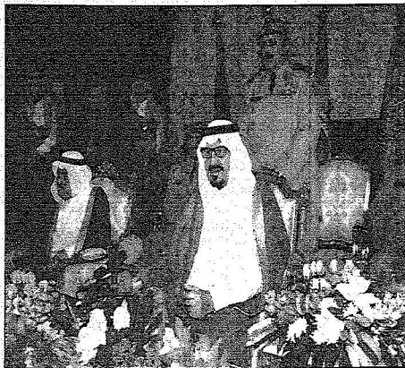
سموه يلقى كفته