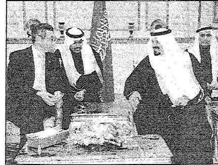
الأمير سلطان يتحدث إلى رئيس الوزراء السنغافوري

ولي العهد يدعو المستثمرين إلى تدعيم العلاقات التجارية والاقتصادية.. وقيم حفل عشاء لرئيس الوزراء السنغافوري