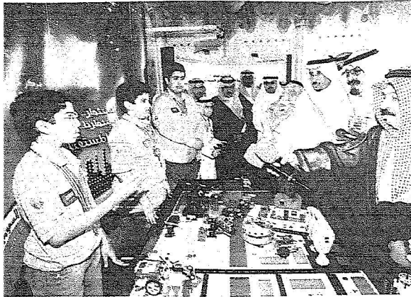
..ويستمع الى طلبة منشأة تعليمية