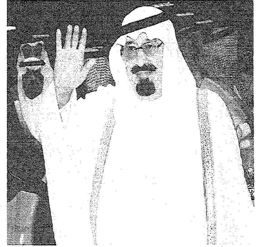
خادم الحرمين الشريفين لدى وصوله مقر الحفل