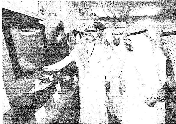
..ويطلع على منتجات احدي الشركات