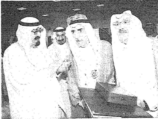
الملك يسلم الشوآاح لابني الشيخ عبدالله السليمان

وتشرف بتسلم الشوآاح من يدي خادم الحرمين الشريفين عبدالعزيز بن عبد الله السليمان، وأحمد بن عبدالله