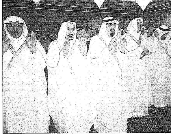
خادم الحرمين الشريفين وولي العهد وعدد من أصحاب السمو الملكي الأمراء يؤدون الصلاة