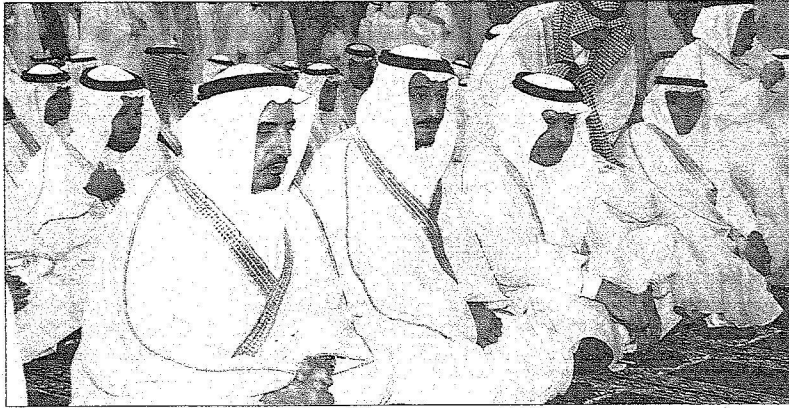
الامير سلمان وعدد من الامراء في صلاة العيد