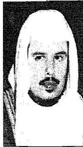
عبد الله آل الشيخ