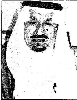
الأمير متعب بن عبد العزيز