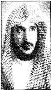
صالح آل الشيخ