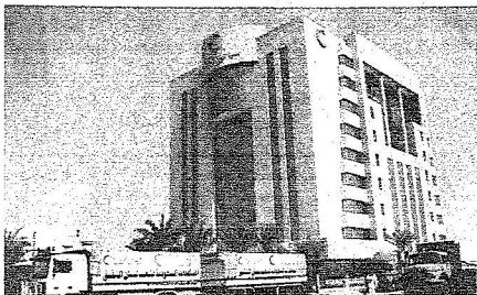
□ تصوير - فتحي كالي

المجال لتقديم مثل هذه التبرعات محتاجها داخل وخارج المملكة فهناك آلاف من الأسر اللبنانية التي تشتد من جراء العدوان الإسرائيلي لأسف التي لا يمكن لأهلها أن يتجاوزوا تلك الأزمة لولا فضل الله عليهم بأن سخر لهم حكومة خادم الحرمين الشريفين الملك عبد الله بن عبد العزيز - حفظة الله - وشعب المملكة الكريم الذي حرص منذ الوهلة الأولى على تقديم كل ما لديهم من أجل التخفيف عن إخوانهم وأشغالهم اللبنانيين.