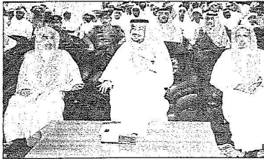
الأمير عبدالعزيز بن ماجد والشيخ الفالح في حفل القرآن بالمسجد النبوي