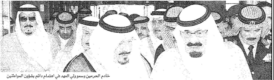
خادم الحرمين ومسؤولي العهد في اهتمام دائم بشؤون المواطنين

بعد الليعة المباركة بدأ مسيرة الجولات التفقدية الداخلية لتشمل كل مدن ومحافظات وطننا