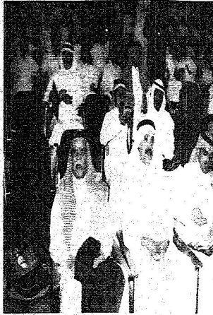
جان من الحضور