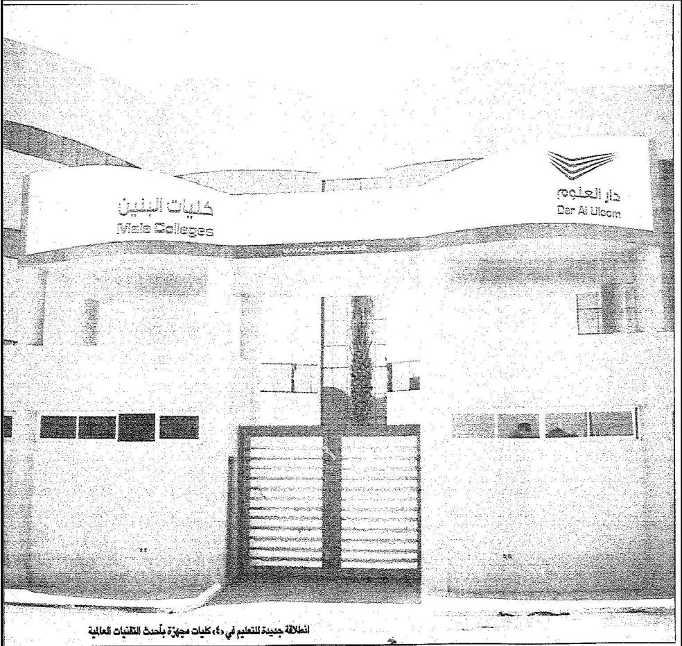
انطلاقة جديدة للتعليم في ٤٠ كليات مجهزة بأحدث التقنيات العالمية