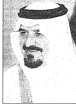
ولي العهد الأمير

من جانبه عبر صاحب السمو الملكي الأمير عبدالعزيز بن سعد بن عبدالعزيز نائب أمير منطقة حائل نائب رئيس الهيئة العليا لتطوير المنطقة (الجزيرة) عن