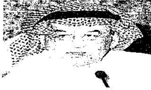
د. غازي القصيبي