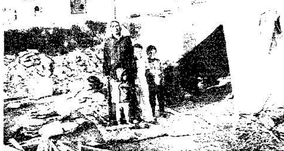
يسكن في الغراء وأبناؤه لا يدرسون