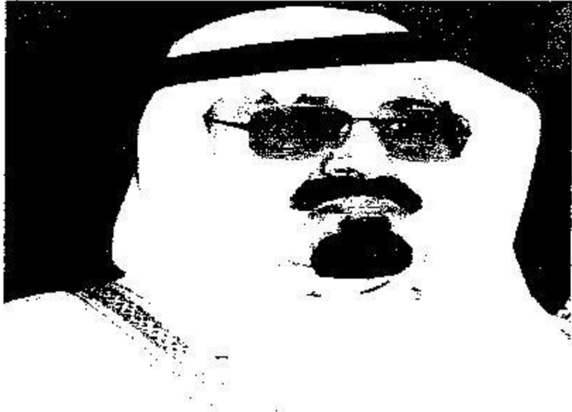
الملك عبد الله بن عبد العزيز في عاصمة السعودية الرياض

وفي هذا الجزء تقدم قصصاً إنسانية لفقراء عرب يعرضون أطفالهم وأعضاءهم للبيع. ونماذج مختصرة عن واقع الفقراء العرب الذين يرفضون كل المساعدات ويطلبون بالتحرك الجاد لاستخراج الزكاة من أثرياء العرب والمسلمين. كما نستعرض في هذا الجزء الاستراتيجية الوطنية في المملكة العربية السعودية لمعالجة الفقر والتي يقودها خادم الحرمين الشريفين الملك عبد الله بن عبد العزيز منذ زيارته الشهيرة لبعض الأحياء الفقيرة في العاصمة السعودية الرياض.