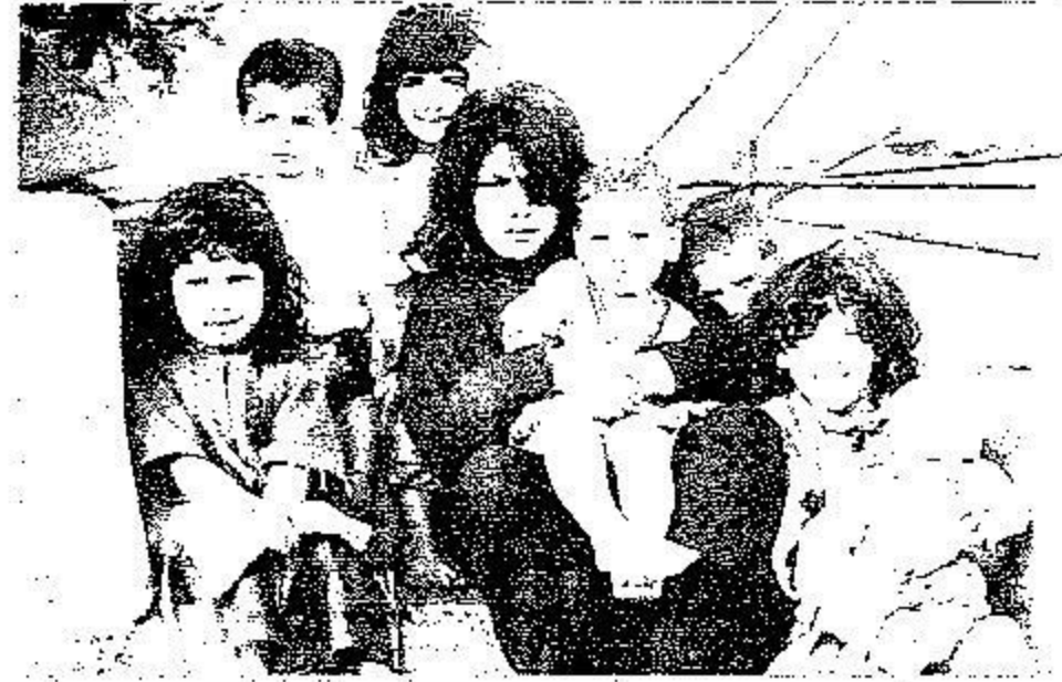
احتفال يمتحنون عن مازي