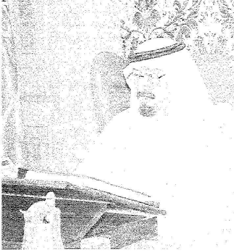
خادم الحرمين الشريفين خلال ترؤسه اجتماع المجلس الاعلى لشؤون البترول