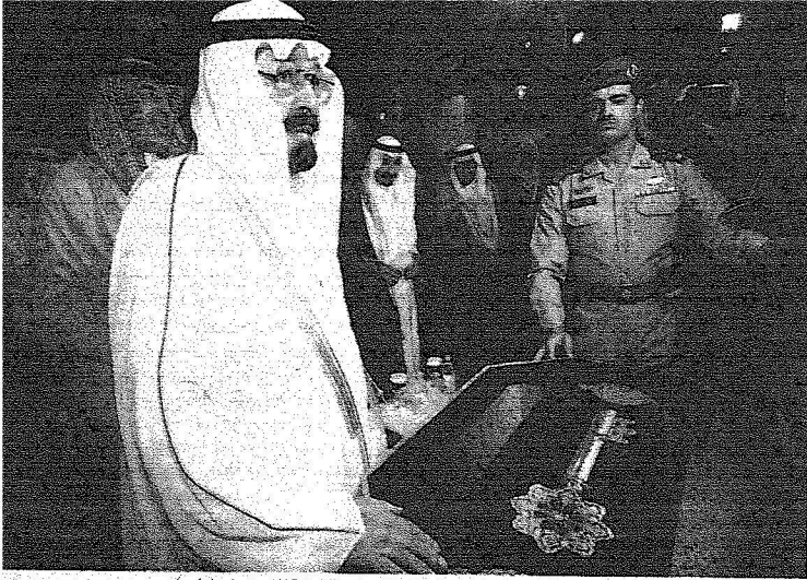
الملك عبد الله يتسلم مديّة تذكارية من الهيئة العامة للاستثمار