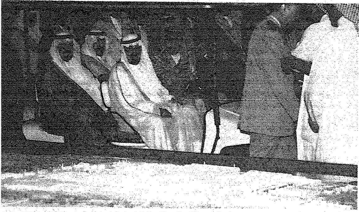
خادم الحرمين الشريفين يطالع على المشروع