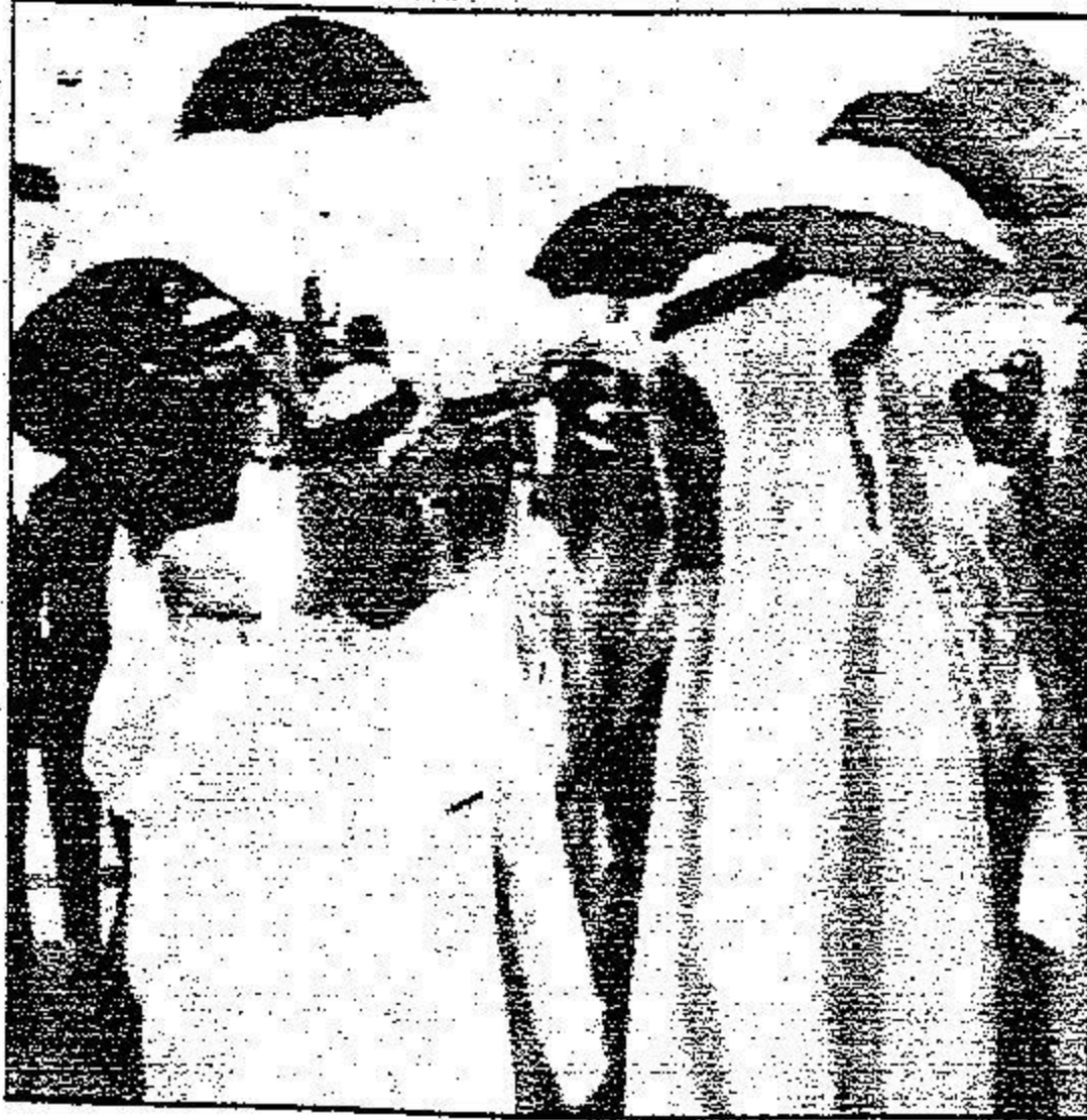
الملك عبدالله يستمع إلى شرح عن المشروعات

التاريخ: 2005-08-27 رقم العدد: 13578 رقم الصفحة: 2 مسلسل: 6 رقم القصاصة: 1