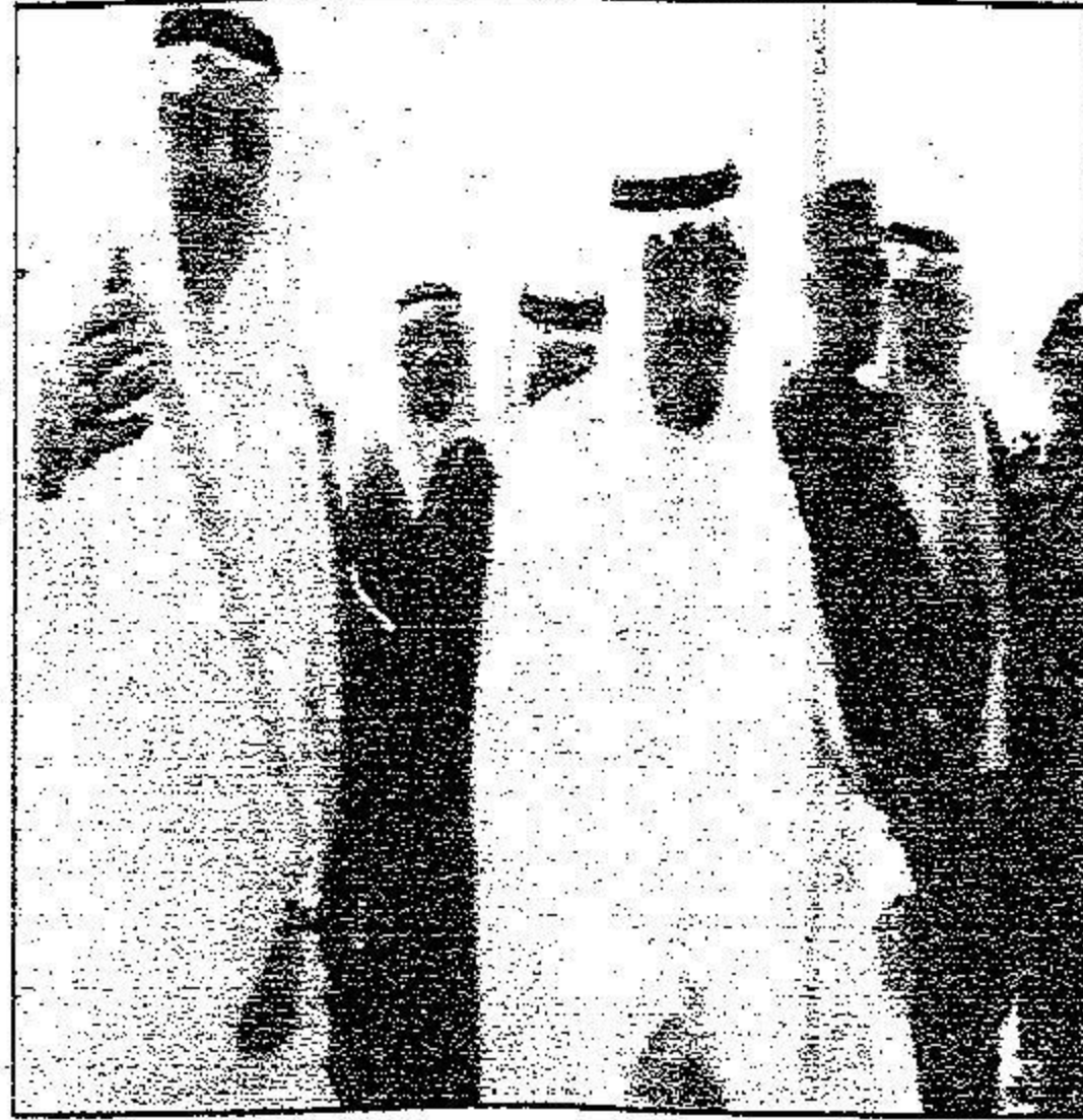
خادم الحرمين يتفقد المشروعات التطويرية في منى