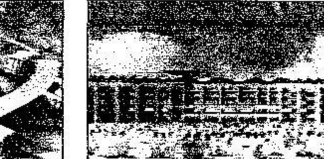
رسوم توضح كيفية للمشروعات التطويرية في منطقة منى

الكبير بضم الحاء وفتح الناس. وأوضح فضيلته ان بطل الحق هو رده و دفعه و عدم القبول به و غمط الناس حوا احتقارهم و الترفع عليهم بكل أنواع الترفع المولية والعملية وقد كان رد الحق تكديبا به و كراهة له واعراضا عنه دين الامم السابقة التي حاق بها العذاب و جاءهم باسم الله ونزل بساحتهم فكان ما اصابهم عبرة للمعتبرين و ذكرى للذاكرين كما قال سبحانه وما تأتيهم من اية من آيات ربهم الا كانوا عنها معرضين، وقال عز اسمه لقد جئناكم بالحق ولكن اكثرتم للحق كارهون، اما أهل الايمان والتقوى فإن من اظهر مسفاتهم القبول بالحق والاحتفاء به والالتقياد له والدعوة اليه وتبنا فهم اعقل الخلق واحكم الناس والنصر العباد باسباب السعادة وادواب الضرر واسرار التوفيق لأن الحكمة ضالة المؤمن ايما وجدما التفتها ولأن في التجاهل عن رد الحق سلامة من مشاركة المضامين المكذبين بآيات الله عزوجل ورسله وقترامه من اجل ذلك قد وسقوا أنفسهم على قبول الحق ممن اجري على لسانه لا يستثنون صبيا او جاهلا او عدوا كما قرره وفي رواية وسقوا الحمل).