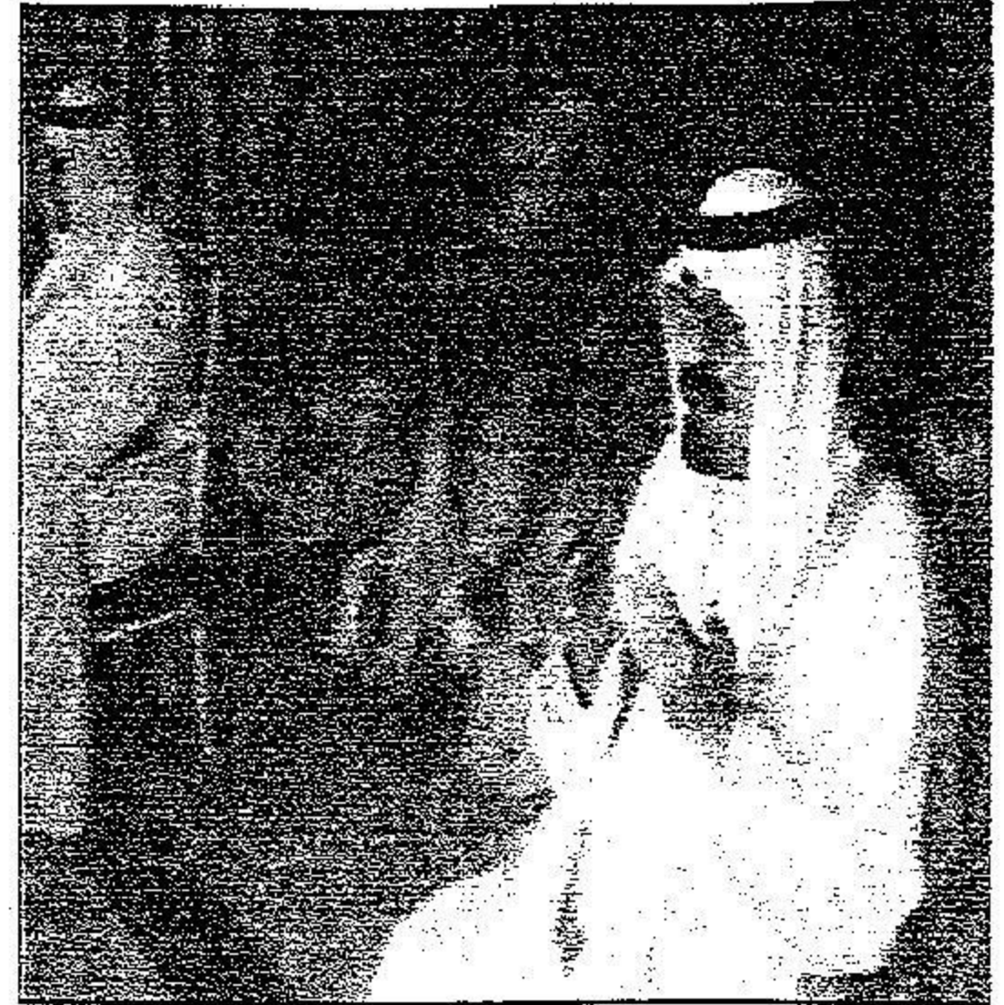
خادم الحرمين خلال أداء صلاة الجمعة في المسجد الحرام

الملك عبدالله أدى صلاة الجمعة مع جموع المصلين في المسجد الحرام.. ووصل إلى جدة