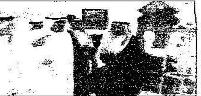
الملك عبداللّه معادرة الى قصر منى

يعد ذلك استمع الملك المقدمي حفظه الله الى شرح واف من مدير ادارة تنفيذ مشاريع المشاعر المقدسة بوزارة الشؤون البلدية والقروية المهندس عبدالرحمن الشهوان عن مشروع تطوير منطقة وجسر الجمرات وما يشتمل عليه من جسور ومنشآت وطرق وأساطق ستؤدي الى انهاء مشكلة الازدحام وتراكم السياح حول الجمرات والساحات وتضمن طائفة استيعابية أكبر تؤدي الى سهولة الترحيل من حدوث أية مشكلات لا سيج الله. كما استمع ايده الله الى شرح عن مشروع امتداد الاتفاق من كبرى الملك خالد الى جهة المعيصم والى جهة مستشمى السور مع التقاطعات والكبارى التي ستؤدي بشيئة الله الى تسهيل حركة المرور من والى منى. بعد ذلك توجه خادم الحرمين الشريفين رعااه الله ومرافقه الى قصر منى.