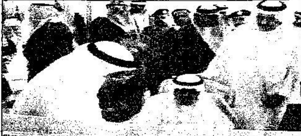
خادم الحرمين يطلق على لصاميم المشروعات

الكبير بضم الحاء وفتح الناس. وأوضح فضيلته ان بطل الحق هو رده و دفعه و عدم القبول به و غمط الناس حوا احتقارهم و الترفع عليهم بكل أنواع الترفع المولية والعملية وقد كان رد الحق تكديبا به و كراهة له واعراضا عنه دين الامم السابقة التي حاق بها العذاب و جاءهم باسم الله ونزل بساحتهم فكان ما اصابهم عبرة للمعتبرين و ذكرى للذاكرين كما قال سبحانه وما تأتيهم من اية من آيات ربهم الا كانوا عنها معرضين، وقال عز اسمه لقد جئناكم بالحق ولكن اكثرتم للحق كارهون، اما أهل الايمان والتقوى فإن من اظهر مسفاتهم القبول بالحق والاحتفاء به والالتقياد له والدعوة اليه وتبنا فهم اعقل الخلق واحكم الناس والنصر العباد باسباب السعادة وادواب الضرر واسرار التوفيق لأن الحكمة ضالة المؤمن ايما وجدما التفتها ولأن في التجاهل عن رد الحق سلامة من مشاركة المضامين المكذبين بآيات الله عزوجل ورسله وقترامه من اجل ذلك قد وسقوا أنفسهم على قبول الحق ممن اجري على لسانه لا يستثنون صبيا او جاهلا او عدوا كما قرره وفي رواية وسقوا الحمل).