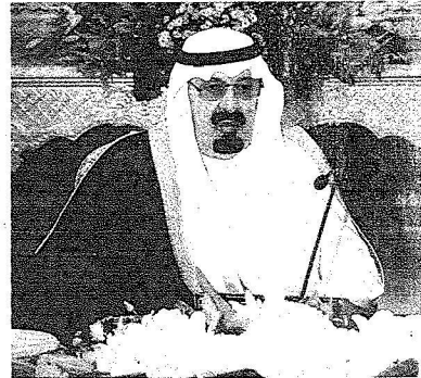
خدام الحرمين الشريفين لدى رئاسته جلسة مجلس الوزراء امس