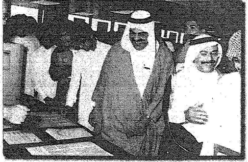
في احدى المناسبات

ازدت اكمال دراستي فانتقلت الى ارامكو وايضا وجدت مشكلة فذهبت الى جامعة استانفورد بامريكا منحة دراسية. لانني كنت مثقوفا دراسيا . وقدمت استقالتي من "كلية البترول" والتحقست باستانفورد . واستطرد معالي الدكتور بكر بن عبد الله بكر حديثه عن معالي الشيخ احمد زكي يماني وقال: حينما علم الشيخ احمد زكي يماني بما تم اتصل بي. وقال لي انني اريدك ان تكون معنا وسوف نضمك للبعثات - وبعد مرور فترة على دراستي اخبرني بصفة خاصة انه يتوقع ان اكون انا عميد "كلية البترول" وعلي ان احصل على الدكتوراه . وقد كان فاجتهدت وحصلت على الدكتوراه في مدة