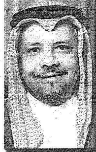
احمد زكي يماني

لست مع فكرة سعودة اعضاء هيئة التدريس في الجامعات هذه فكرة يجب اعادة النظر فيها فالسعودة هي ان تأتي باعضاء تدريس متميزين يخرجون طلابا متميزين وهؤلاء الطلاب المتميزون هم الذين يحلون (محل غير السعوديين) وفي هذه الحالة سيكونون مثلهم .. واحسن منهم.