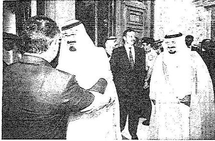
خادم الحرمين في مقدمة مستقبلي وموذي الملك عبدالله الثاني