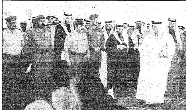
الأمير فهد بن سلطان في منفذ حالة عمان

من جهة أخرى قام صاحب السمو الملكي الأمير فهد بن سلطان بن عبدالعزيز أمير منطقة تبوك المشرف العام على أعمال الحج والعمرة بمنفذ حالة عمان بزيارة تفقدية لمدينة الحج بمنفذ حالة عمان بمنطقة تبوك اطلع سموه على أعمال الجوازات في الحج والإجراءات التي يتم بها دخول الحجاج، وقد أثنى سموه على العاملين في جوازات منفذ حالة عمان مطالبيا الجميع بمواسلة العمل بكل جد واجتهاد لخدمة ضيوف الرحمن والعمل على راحتهم انفاذا لتوجيهات حكومة خادم الحرمين الشريفين.