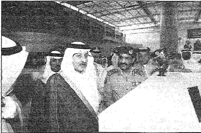
الأمير خالد الفيصل يتفقد مطار الملك عبد العزيز بجدة