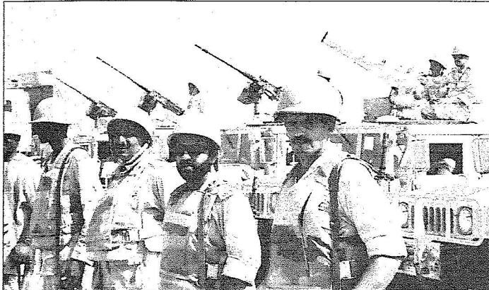
أفراد من القوات المسلحة يتقدمون مدرعاتهم المتمركزة قرب جبل الدود على الشريط الحدودي مع اليمن أس.

لافتاً في الوقت ذاته إلى أن استمرار القوات العسكرية في المنطقة الحدودية سيتواصل «حتى نتأكد من أن المناطق المتقدمة آمنة وتجمعات العصابات المنسلة والإرهابية غير موجودة»، مضيفاً «أننا لن نوقف الضربات الجوية حتى يعودوا عشرات الكيلو مترات عن حدود المملكة.