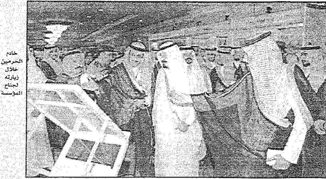
خادم الحرمين خلال زيارته لمنح المؤسسة

- تم اختيار ستة مشاريع من خلال منهجية علمية وعملية، إذ تم حصر العديد من المقترحات، وتقويمها بناءً على معايير عدة منها الجاهزية، والتأثير، والتكلفة، ووقت التنفيذ.