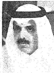
سمو أمين مدينة الرياض

اليوم الوطني تكون هذه الاحتفالات ولكن مع الوقت نحرص على إقامة برامج في الحدائق الرئيسية الكبيرة، أما التوجه الثاني في نهاية هذا الشهر فهو برنامج المساحات المليئة حيث تم الانتهاء من تشييد الساحة الأولى في حي السعودي التي تقع بالغرب من