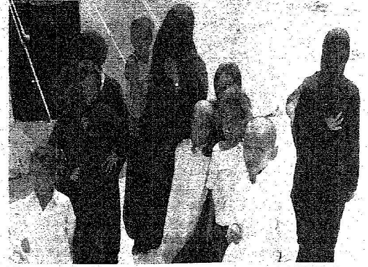
اطفال حرقهم الشمس المحرقة