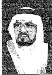
د. منصور النزهة

بداية قال معالي مدير جامعة طيبة الدكتور منصور النزهة قال اني اهنئ نفسي وجميع اخواني المسلمين في كل مكان وكذلك اهالي المدينة المنورة على هذا الامر السامي الكريم الذي ادخل السعادة والفرحة في نفوس المسلمين اجمع نعم ان امر خادم الحرمين الشريفين الملك عبدالله بن عبدالعزيز حفظه الله في فتح ابواب المسجد النبوي الشريف طوال الليل والنهار له صدى كبيراً يحققه هذا من باب التسهيل على المسلمين من المصلين سواء الفروض او النوافل وكذلك من يتشرف بالسلام على رسول الله صلى الله عليه وسلم ان فتح ابواب المسجد النبوي طوال الليالي والايام سيقتضي على الزحام وكذلك اعطاء مجال اوسع في توزيع هذه الاعداد الغفيرة من المسلمين وبالتأكيد سدوف يلهمس الجميع هذا الامر ويخفف الزحام نسأل الله العلي العظيم ان يجعل هذا الامر في موازين حسناته.