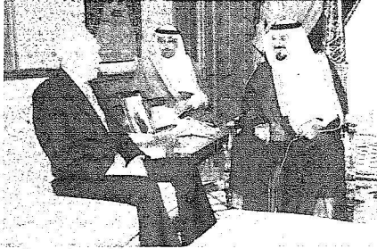
سموه يستقبل الوزير السنغافوري

لمجلس الخدمة العسكرية. وفى بداية الاجتماع استمع المجلس الى تقرير الأمين العام عن الفترة الواقعة بين آخر اجتماع للمجلس والاجتماع الحالي لتوضيح ما تم على قرارات الاجتماع السابق للمجلس التى صدرت كلها ما عدا القرار المتعلق بتعديل جدول تعيين خريجي المراقق التعليمية والذى أحيل الى مجلس الوزراء لاستكمال الاجراءات النظامية اللازمة وقرار المجلس الخاص بصرف يومية ميدان كاملة للعسكريين من