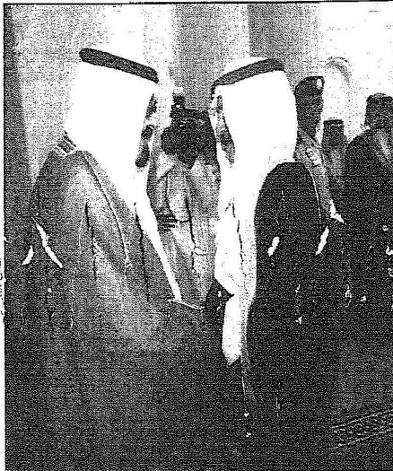
الملك عبدالله يستقبل الشيخ خليفة

كما كان في استقبال الشيخ خليفة آل خليفة صاحب السمو الملكي الأمير