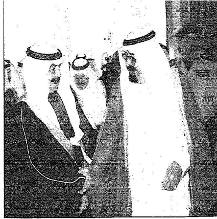
الملك عبدالله خلال استقباله رئيس الوزراء البحريني أمس..