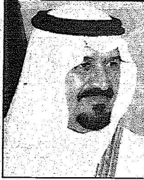
الأمير سلطان بن عبدالعزيز

قاعدة الملك فيصل الجوية بالشمال الغربية ونقل تهاني وتبريكات خادم الحرمين الشريفين الملك عبدالله بن عبدالعزيز -الرحماني العابد الأعلى لكافة القطاعات العسكرية لمنسوبي قاعدة الملك فيصل الجوية بالشمال الغربية بمناسبة عيد الفطر المبارك.