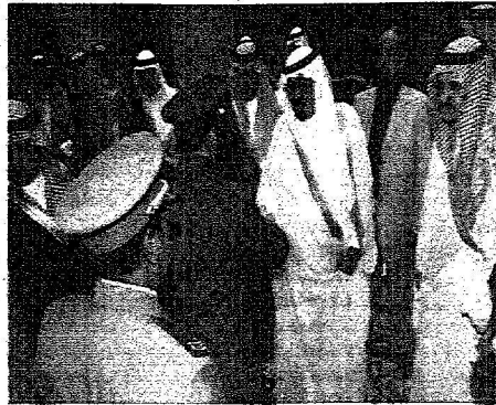
خادم الحرمين لدى وصوله جدة