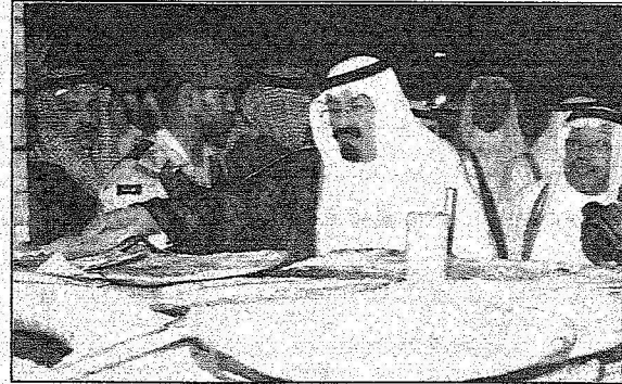
الملك عبد الله يتفقد الأكلات المكية

ضحى وتشرّف بالسلام عليه ابده الله عدد من المشاركين في أداء هذا الفلكلور الشعبي المرافق للابويرت. اذر ذلك تسلّم خادم الحرمين الشريفين الملك عبد الله بن عبد العزيز هدية أهالي مكة المكرمة قدهما نيابة عنهم كبير سادة بيت الله الحرام الشيخ عبد العزيز القضيبي بهذه المناسبة. اثر ذلك القيت كلمة سيدات مكة المكرمة اقتها نيابة عنهم الدكتور رباب بنت صالح محمد جمال عبر النافذة التلفزيونية المعلقة عبرت فيها عن السعادة الفاصلة بهذه الزيارة للمشاركة لخادم الحرمين الشريفين الملك عبد الله بن عبد العزيز بإبده الله