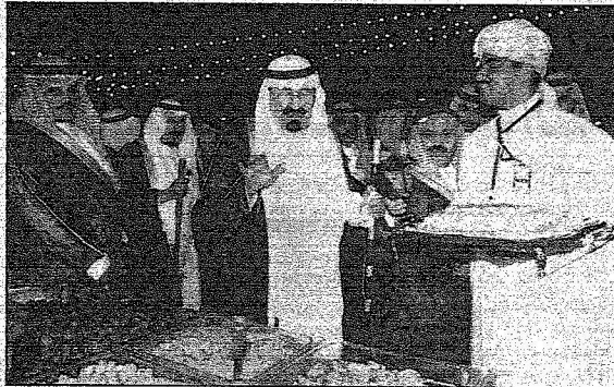
الملك عبد الله يتفقد الحلويات المكية

سيدات مكة: أملنا أن تعود المرأة على أيديكم إلى مكانتها الأولى في الإسلام وأن تنال نصيبها من التكريم