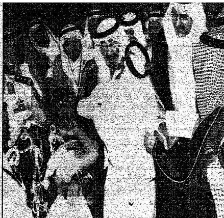
أبو حنيفة من خادم الحرمين لأحد أعيان مكة