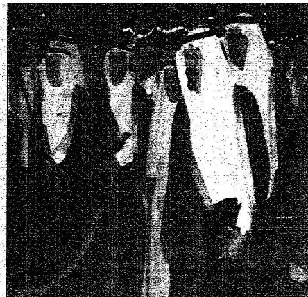
وصول خادم الحرمين لعقد الاحتفال

تجول في جناح أسواق مكة القديمة وشارك الأهالي في أداء فلكلور شعبي.. ووصل إلى جدة